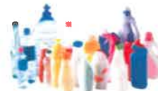
TOUS LES Emballages en plastique

Bouteilles - flacons - produits ménagers et d'hygiène