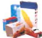
Toutes les Cartonnettes